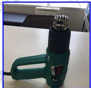
■本体を自立させて使用することも可能です。