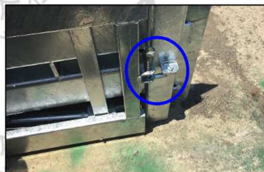
■収納時はロックがついて安全です。