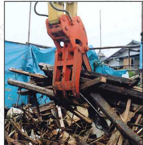
■廃材の積み込み作業に