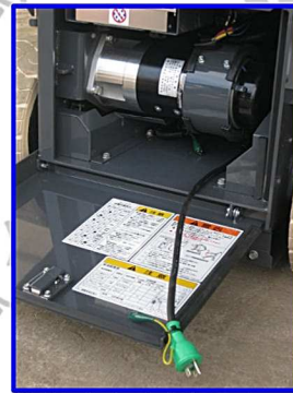
●充電用コネクター (昇降口の下にあります)