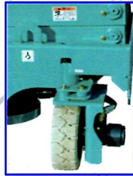
●ホワイトタイヤを採用