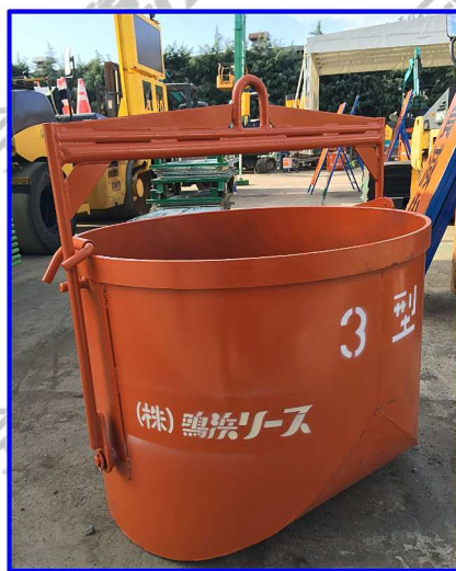
●0.3m 3 丸型転倒バケツ