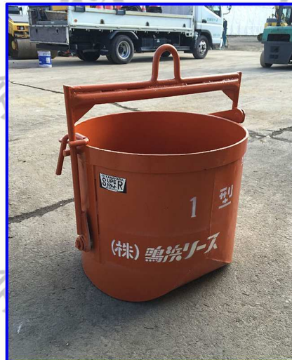
●0.1m 3 丸型転倒バケツ