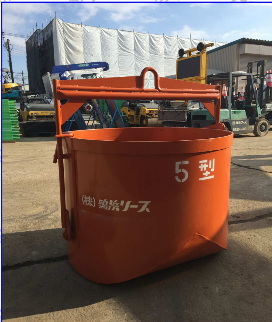
●0.5m 3 丸型転倒バケツ